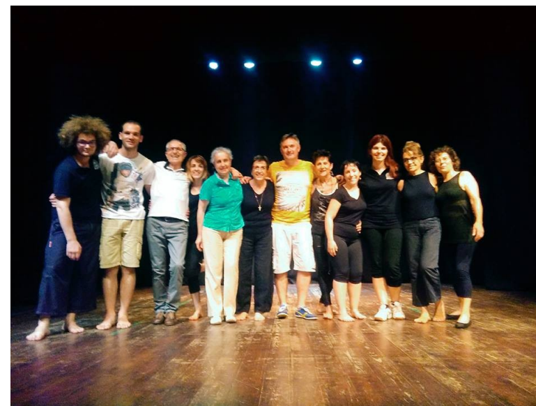
Photo stage franco-italien 25-26 juin 2016 à Florence - Teatro L'Affratellamento - élèves français et italiens

En plus de ses ateliers théâtre en France, la Compagnie PerBacco ouvre également les portes de son école amateur en Italie au théâtre L'Affratellamento de Florence en collaboration avec l'association culturelle Itinera di Firenze. Une rencontre entre les étudiants français et les étudiants italiens a eu lieu en juin 2016 et une autre est prévue pour juin 2017 Les but est de les faire se découvrir et travailler ensemble.